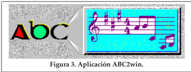
Figura 3. Aplicación ABC2win.

del formato ABC. Esta aplicación se muestra en la Figura 3 .